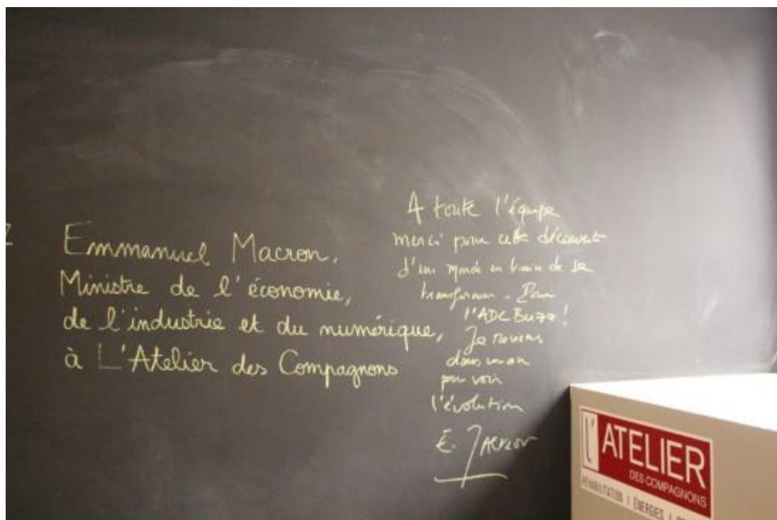
© Pierre Pichère - Petit mot sur le tableau

Finissant sa visite dans la vaste salle qui sert d'espace de détente aux salariés de l'Atelier des Compagnons, Emmanuel Macron a promis, dans un mot écrit à la craie sur le tableau noir qui sert à stimuler l'innovation, de revenir l'an prochain pour mesurer les progrès accomplis. Il n'a toutefois pas été jusqu'à presser le buzzer qui diffuse un titre du groupe de hard rock AC/DC dans toute l'entreprise lorsqu'un salarié tient l'idée révolutionnaire !